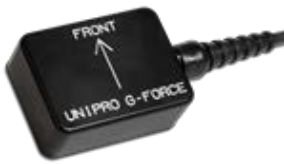
G-フォースセンサー