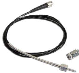
エキゾーストセンサー