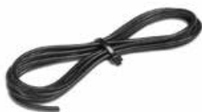
RPM wire (※1)