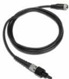
Water temperature sensor, incl.cable