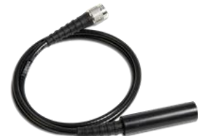
マグネットレシーバー