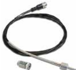
Exhaust temperature sensor