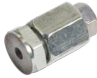
エキゾーストフィッティング