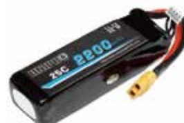
Battery,Lipo 11.1V 2200mAh