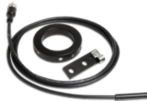
スピードKit(リヤシャフト50Φ)