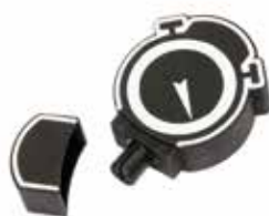
USB Flash Key