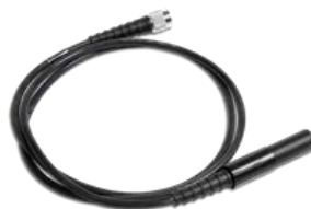
ループレシーバー