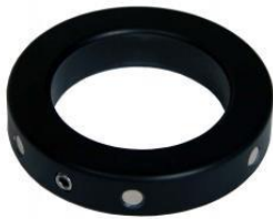
スピードセンサーディスク