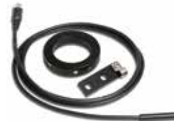
Speed Kit for rear axle,50mm