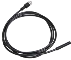
スピードセンサー175mm