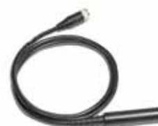
Magnet receiver (※1)