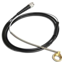
シリンダーヘッドセンサー2.0mm